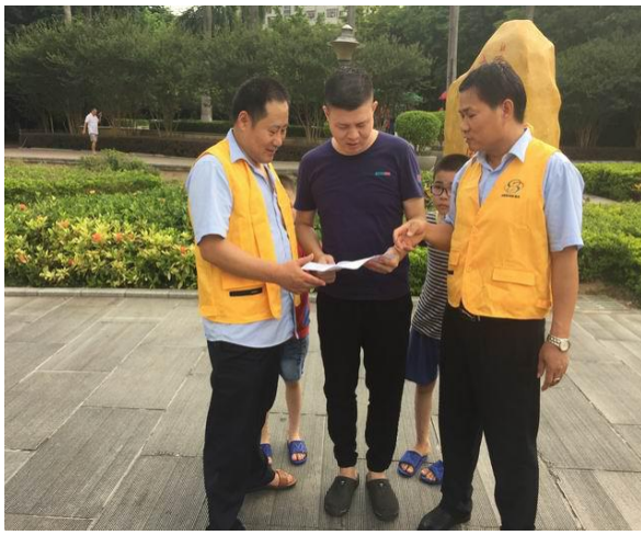
会员向市民派发绿色出行宣传资料