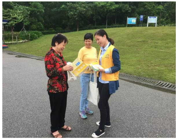
会员向市民派发绿色出行宣传资料