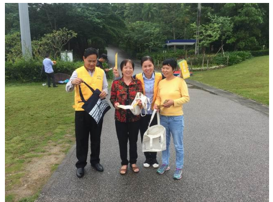
会员向市民派发绿色出行宣传资料