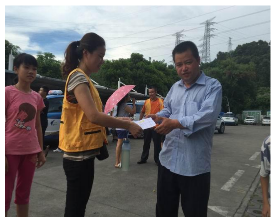
会员向市民派发绿色出行宣传资料