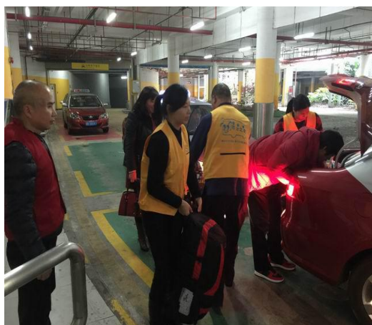
巴士之友会员引导乘客上车