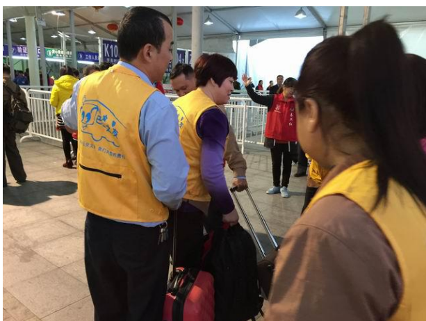
巴士之友会员为有需要的乘客服务