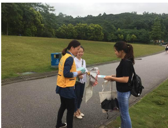
会员向市民派发绿色出行宣传资料