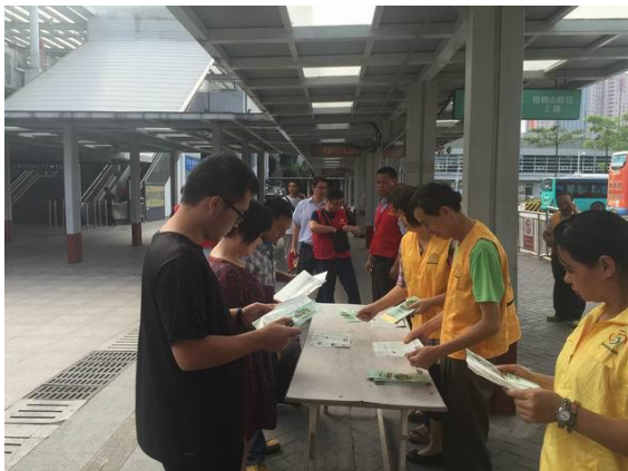
会员向市民派发绿色出行宣传资料