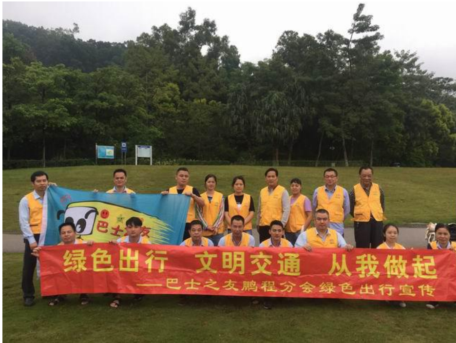
巴士之友会员在活动中合影